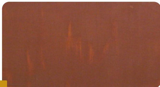
Fot 3 FINALNY EFEKT