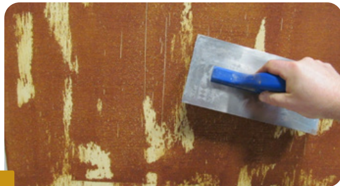
Fot. 2 NAKŁADANIE KOLEJNEJ WARSTWY ZA POMOCĄ PACY NIERDZEWNEJ

Należy pamiętać, że pola, gdzie nie nałożono tynku za pomocą pędzla w pierwszej warstwie, będą widoczne jako jaśniejsze przebarwienia więc ich ilość i rozmieszczenie należy dobierać do oczekiwanego efektu wizualnego. Kolejną warstwę masy tynkarskiej nakładać za pomocą pacy nierdzewnej na grubość ziarna, a następnie zagładzić w celu zniwelowania nierówności i pozostawić do wyschnięcia.