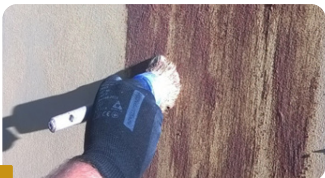
Fot.1 NANOSZENIE TYNKU BOLIX RUST ZA POMOCĄ PĘDZLA

Dekoracyjną masę tynkarską BOLIX Deco BM w kolorze 35 Rust bezpośrednio przed użyciem przemieszać mieszarką wolnoobrotową do uzyskania jednorodnej konsystencji. Masę tynkarską nanosić w dwóch warstwach. W pierwszym etapie tynk nałożyć za pomocą pędzla, układając tynk w pionowe nadając charakterystykę nieciągłych i nieregularnych pasów imitujących zacieki, a następnie wygładzić nierówności za pomocą pacy stalowej i pozostawić do wyschnięcia.