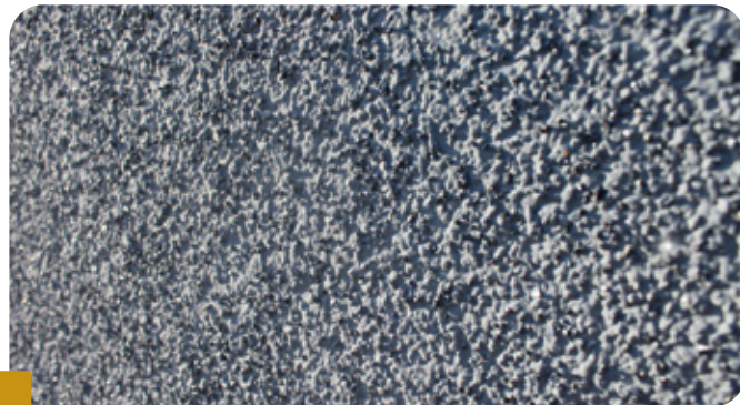
Fot. 3 GOTOWY EFEKT BOLIX DIAMENT

Pistolet należy prowadzić w odległości około 30 - 50 cm od podłoża ruchem okrężnym zataczając kręgi o średnicy około 20-25 cm jednocześnie przesuwać się w poziomie i/lub w pionie. Strumień powinien być kierowany na podłoże pod kątem prostym. Pamiętać trzeba, że wykonany warstwa jest jednocześnie ostatecznym wykończeniem i jej wygląd stanowi o efekcie wizualnym.