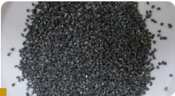
Fot 1 KAMYCZKI WĘGLIKA KRZEMU

Zaleca się kompresor o wydajności nie mniejszej niż 350 l/min i rozmiar dyszy 4 - 6 mm, ciśnienie robocze około 3 atmosfery.