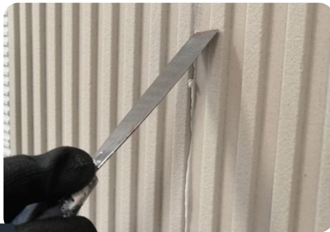
Fot. 5 USÓWANIE NADMIARU MASY

Nadmiar masy wypływający z łączeń usunąć przy użyciu wilgotnej gąbki, pędzla lub szpachelki przed zaschnięciem.