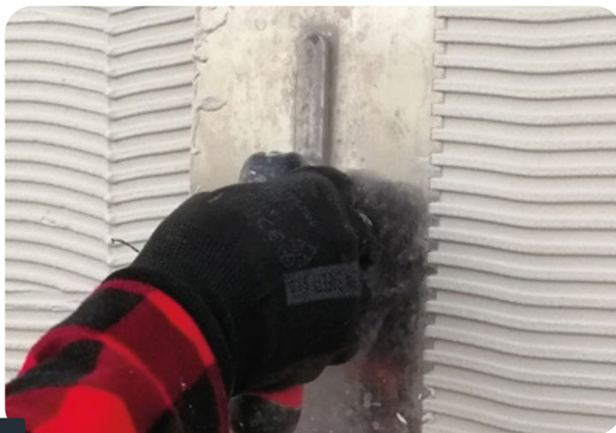
Fot. 1 NAKŁADANIE MASY KLEJĄCEJ.

Przygotowaną masę klejącą nałożyć na podłoże i wetrzeć dokładnie pacą zębatą 6x6 mm ostatecznie rozcierając masę w kierunku poziomym - prostopadłym względem dłuższego boku przyklejanych paneli.