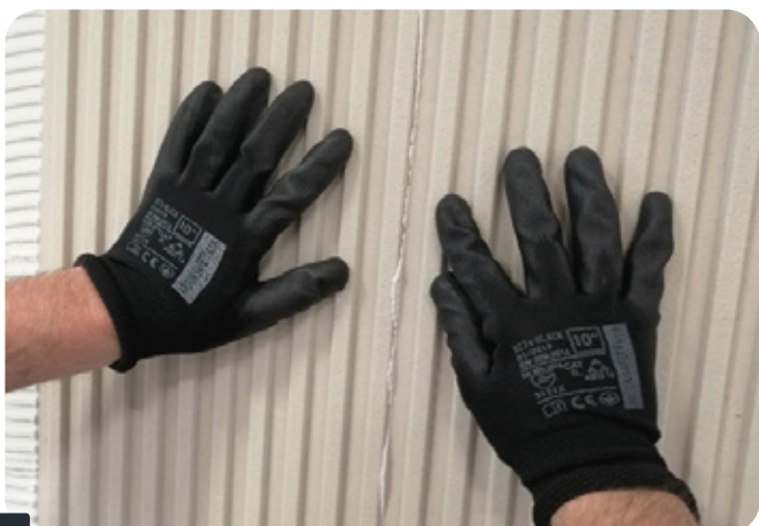
Fot. 4 ŁĄCZENIE PANELI

Nadmiar masy wypływający z łączeń usunąć przy użyciu wilgotnej gąbki, pędzla lub szpachelki przed zaschnięciem.