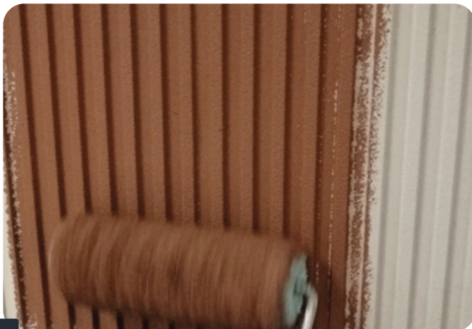
Fot. 6 NAKŁADANIE FARBY BOLIX SIL W WYBRANYM KOLORZE

Po minimum 48h od przyklejenia paneli nałożyć farbę elewacyjną BOLIX SIL w dowolnym kolorze. Farbę nakładać w minimum dwóch warstwach dokładnie rozprowadzając pędzlem lub wałkiem z długim włosiem wzdłuż wzoru, nie dopuszczając do pozostawiania nadmiaru farby w zagłębieniach.