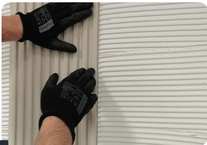
Fot. 2 NAKLEJANIE PANELI

Poszczególne panele docisnąć wałkiem do dociskania tapet jednocześnie zwracając uwagę, by cały panel przylegał dokładnie do powierzchni podłoża, a wszystkie pustki powietrzne zostały usunięte.