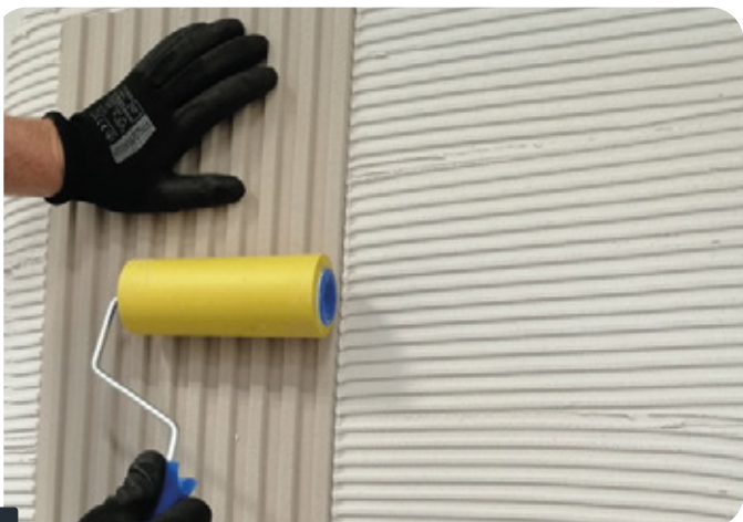
Fot. 3 DOCISKANIE PANELA WAŁKIEM

Poszczególne panele docisnąć wałkiem do dociskania tapet jednocześnie zwracając uwagę, by cały panel przylegał dokładnie do powierzchni podłoża, a wszystkie pustki powietrzne zostały usunięte.