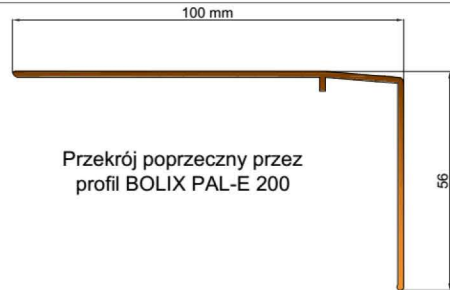
Przekrój poprzeczny przez profil BOLIX PAL-E 200